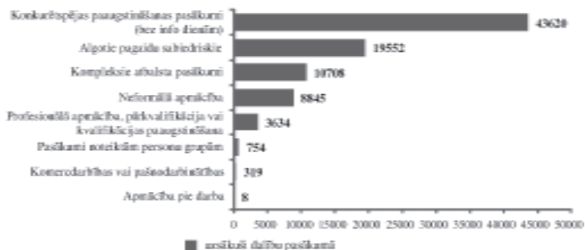
1. attēls. 2012. gada 8 mēnešos uzsākušie dalību NVA pasākumos (Bezdarba situācija valstī, 2012)

Reģistrētā bezdarba līmenis valstī 2012. gada augusta beigās bija 11,3% (bezdarbnieku īpatsvars ekonomiski aktīvo iedzīvotāju kopskaitā). Augstākais bezdarba līmenis tika reģistrēts Latgales reģionā – 22,0%. 2012. gada 8 mēnešos NVA organizētajos aktīvajos nodarbinātības pasākumos ir piedalījušies 136,4 tūkst. bezdarbnieki (viens cilvēks var piedalīties vairākās aktivitātēs) (Bezdarba situācija valstī, 2012).