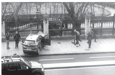
Uzbrukums Londonā 22.03.2017.