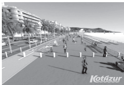
Esošie ierobežojoši krastmalā Nīcā