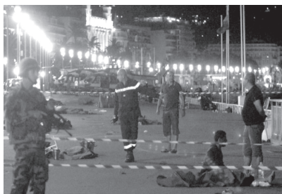
Uzbrukums Angļu krastmalā Nīcā

diti ierobežojoši elementi. Pēc vairākiem terora aktiem, izmantojot automašīnu, Londonas centrā 2017. gadā, policija sagatavoja speciālu līdzekli, kurš viegli novietojams uz brauktuves. Izstrādājums ieguvis nosaukumu “Nags” (Talon). Speciāls tīkls ar radzēm spēj apturēt 17 tonnas smagu auto. Speciālo līdzekli uz brauktuves viegli novietot spēj divi darbinieki.