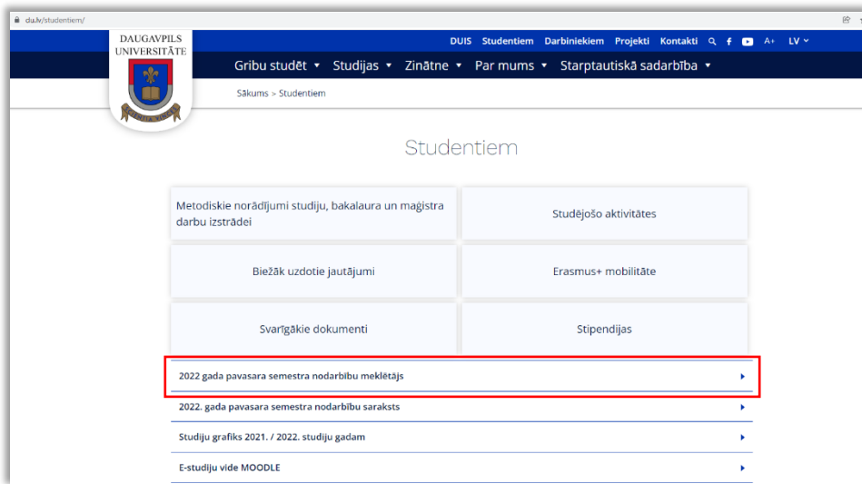
1. att. DU mājaslapas sadaļa “Studentiem”